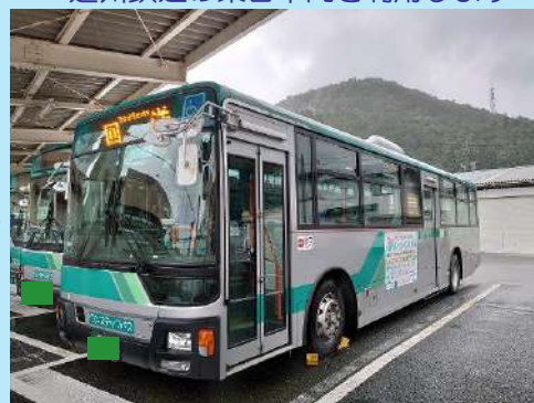
※車両はイメージです