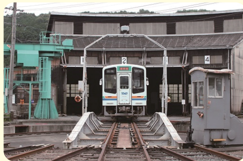
※写真・イラストは全てイメージです。