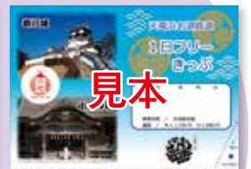
家康デザイン 天浜線 1日フリーきっぷ