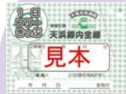
天浜線 1日フリーきっぷ