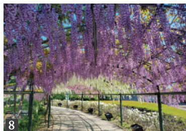
8. 「はままつフラワーパーク」虹のフジのトンネル 9. 「浜名湖ガーデンパーク」のネモフィラ展望台

全国屈指の花の産地である浜松・浜名湖地域は、四季折々、彩り豊かな花の公園等が多数立地しています。 浜名湖花博2024が開催中のはままつフラワーパークでは日本初の女性樹木医である理事長の塚本こなみ先生のご案内で園内を巡ります。加えて「アメイジングガーデン・浜名湖」に登録されたすべての花と庭園の名所をお楽しみいただく贅沢な旅。 1日目の昼食は、ジビエなどのフランス料理、旬の魚や地元野菜を使用したフレンチの名店「船明荘」が出張でコース料理を提供。天浜線の構内に停車した車両内で味わう特別な体験を是非。