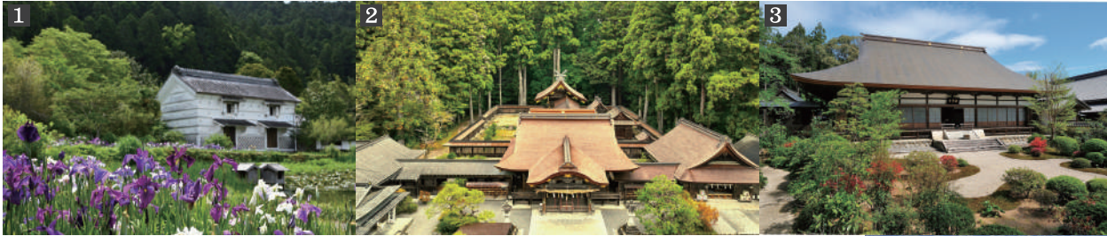
1. 加茂荘花鳥園の花菖蒲と庄屋屋敷 2. 小國神社 拝殿正面 3. 龍潭寺 (写真はすべてイメージ)