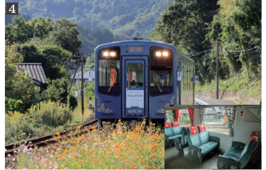
4. 貸切車両「スローライフトレイン」、車内の食事場所イメージ