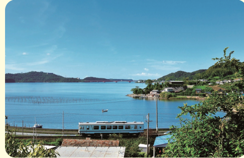
浜名湖沿いを走る天浜線車両

天浜線には国鉄二俣線の時代から使用している施設が多く存在し、全線で駅本屋・プラットフォーム・転車台・扇形車庫など、全36施設が国登録有形文化財に登録されています。