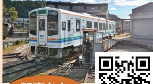
転車台を 乗車体験