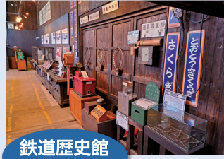
鉄道歴史館 の見学