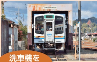
洗車機を 乗車体験