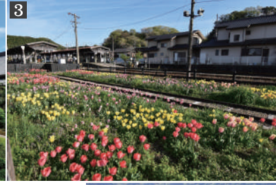
1. 小國神社 拝殿正面 2. 龍潭寺 3. 天竜二俣駅 ペレニアルガーデン (写真はすべてイメージ)