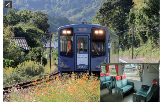
4. 貸切車両「スローライフトレイン」、車内の食事場所イメージ

お部屋：ツインルーム (エグゼクティブツイン) またはシングルルーム お風呂：露天風呂、大浴場、サウナ お食事：夕食、朝食とも四季折々の浜名湖の素材を取り入れたビュッフェ